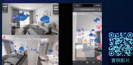
遠端沉浸式賞屋體驗 透過 audience 導覽 3D 設計物件，帶領客戶自由移動，探訪每個空間的設計細節。

觀眾可以根據個人喜好，自由切換多台 VR 攝影機視角，獲取更全面的觀看體驗，讓每一次的觀賞都是最獨特的立體感官盛宴。