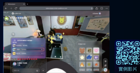
客製化互動體驗及 API 應用 透過創新的 VR Emoji、即時投票與同步集氣功能，拉近與觀眾的距離！

觀眾只需掃描 QR Code 即可觀看直播，這得益於以 WebXR 為核心的技術支持，讓用戶在電腦、手機或 VR 眼鏡上都能輕鬆鏈結虛實間的互動體驗，享受全新的感官饗宴。