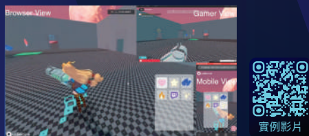
audience SDK 整合 透過 SDK 整合，輕鬆將虛擬世界的內容廣播給大量觀眾，輕鬆鏈結虛擬世界裡的互動體驗。